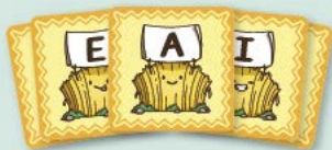
7 cartas de trigal