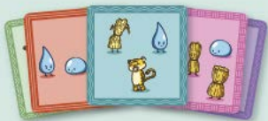
53 cartas de trabalinguas