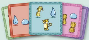
53 cartas de trabalenguas