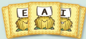
7 cartas de trigal