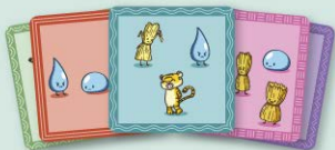
53 cartes d'embarbussaments