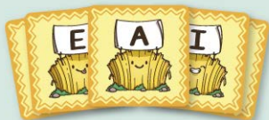
7 cartes de tria